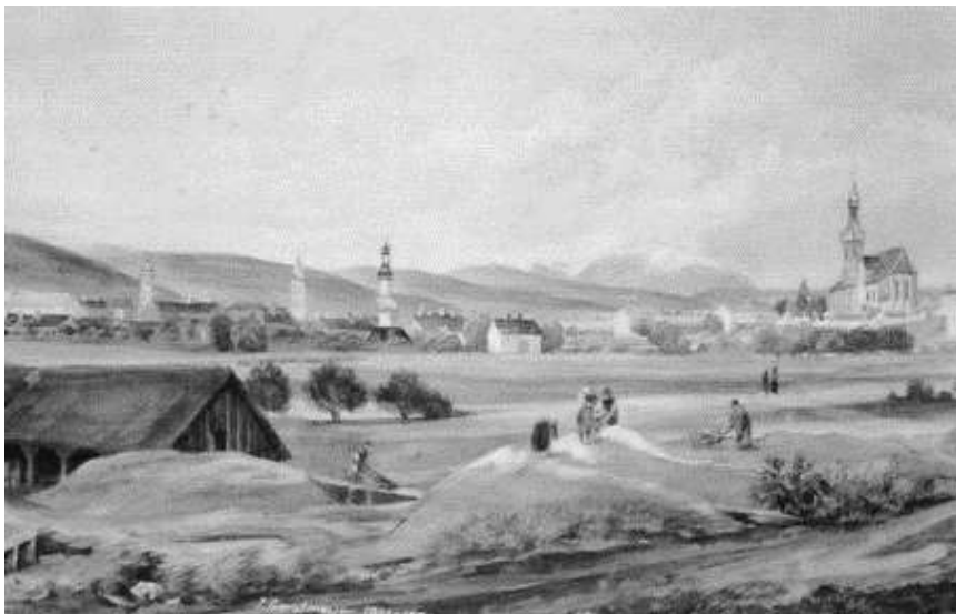
3. kép. Greistmeier festménye Sopronról, 19. század közepe (reprint képeslap)

szennyezettsége ekkortájt kezdett feltűnővé válni: tisztítását 1852-től sürgették, és a meder kövezése is aktuálissá vált. A Rák-patak fő medre a mai Deák tér mentén haladt: itt volt az árapasztója is. 1841-ben kezdték meg a belterületi szakaszok csatornázását, és a patak vizével öblítették a csatornahálózatot.