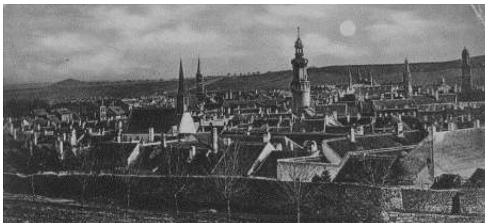
4. kép. Sopron, 20. század eleje

Az 1926-os katonai térképen 89 ennek megfelelő városképet látunk: a belvárosi vonalvezetése változatlan, képét Szeghalmy Gyula a régi Nürnberg és a Hanza-városok „szűk sikátoraihoz” hasonlította. 90 A korábbi kompakt város képe ekkor más, rokon jellegű településeknél is megfigyelhető szabályosságok szerint alakult át. Körülötte egyre bővültek a külvárosok, a lakott terület az utak mentén sugárirányban terjedt, a peremterületekre gyárok települtek.