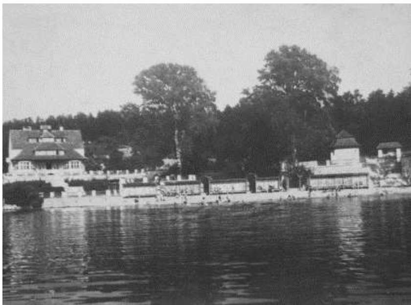
7. kép. Strand a Tómalomnál, 20. század eleje

létesítenek. A tározó első üteme 1964-ben valósult meg, 108 Görbehalomtól északnyugatra, Brennergi-tároló néven. 109 A két Tómalom környékén már a század eleje óta kiépített strand van, 110 akárcsak a Fertőnél (7. kép). 111