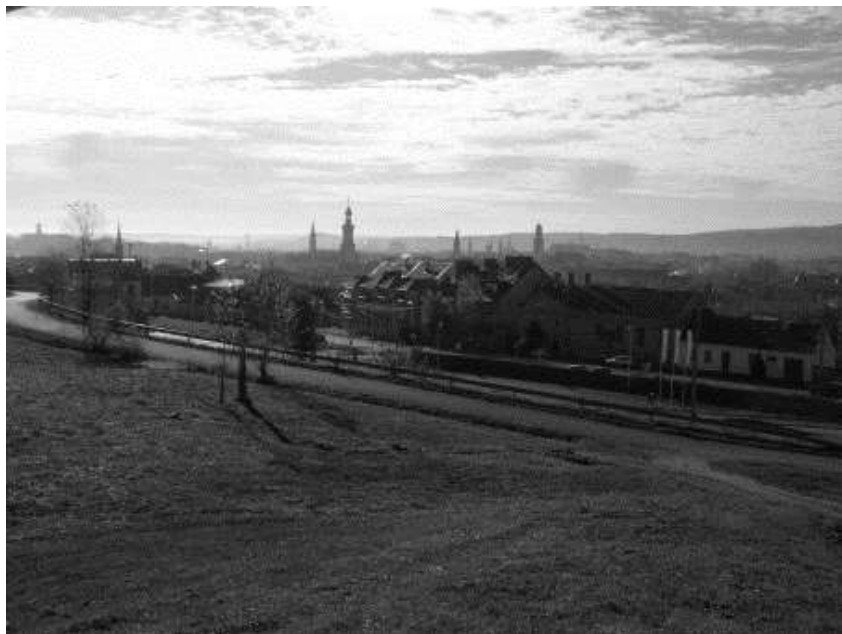
6. kép. Sopron látképe ma, a Bécsi domb felől

A falvakat számba véve, Balf viszonylag keveset nőtt az 1926-os felmérés óta: észak-déli irányban lehet fejlődést megfigyelni. A gyógyfürdő kastélya a falu nyugati részén, sétára alkalmas parkban áll. A község felé Kópháza „eresztett nyúlvány”: kevés választja el a két települést az összeéréstől. Brennbergbányát 1948 után államosították, nem sokkal később, 1952-ben megszüntették a széntermelést. 105 Ma a bányászatra az 1968-ban megnyitott emlékmúzeum utal vissza, 106 széntermelés már nem folyik. A település kiterjedése nem sokat változott 1926 óta, nagyjából ugyanazon a területen kicsivel több ház áll, de a beépítés még mindig falusias. A terület intenzívebb beépítését – a falu összképének előnyére – az egykori aknák és bányajáratok akadályozzák: az alábányászott részekre veszélyes lenne házakat emelni. 107 Megemlí-tendő a számtalan meddőhányó is, amelyek ma már eltűnnek az avatatlan szemlélő elől, pedig a település mai főtere is a szénosztályozó meddője által elplánírozott térszínen jött létre.