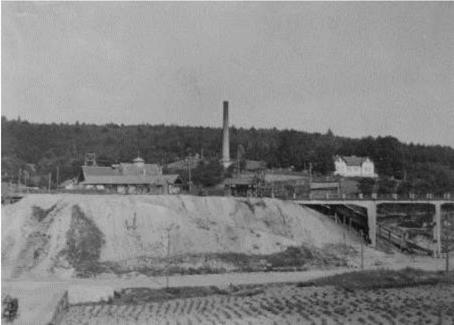
5. kép. Brennbergbánya, 20. század első fele (Soproni Levéltár képgyűjteménye)

A patakok vonatkozásában kiemelhető a Rák-patak már említett beboltozása, valamint az Ikva mederburkolatának javítása a mederrendezési terv szerint. A Fertő nyílt vízfelülete ekkor csökkenést mutatott az 1845-ös állapothoz képest: a nádas területe növekedett, de ugyanakkor beljebb is húzódott, korábbi területének part menti részét rét és szántó borította. Fontolgatták a tó lecsapolását a két világháború között, ám a tervzetből nem lett semmi: a tó sokkal értékesebb volt tájképi, turisztikai és szőlőtermesztési szempontból egyaránt, mint a száraz meder. 93