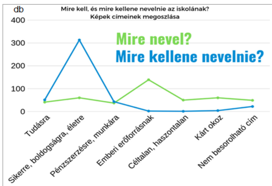
2. sz. ábra: Mire nevel és mire kellene nevelnie az iskolának? Címek megoszlása. (N=436)

Ennél is szembeűnőbbek a különbségek, ha egyetlen grafikonra rajzoljuk a válaszok megoszlását (2. ábra):