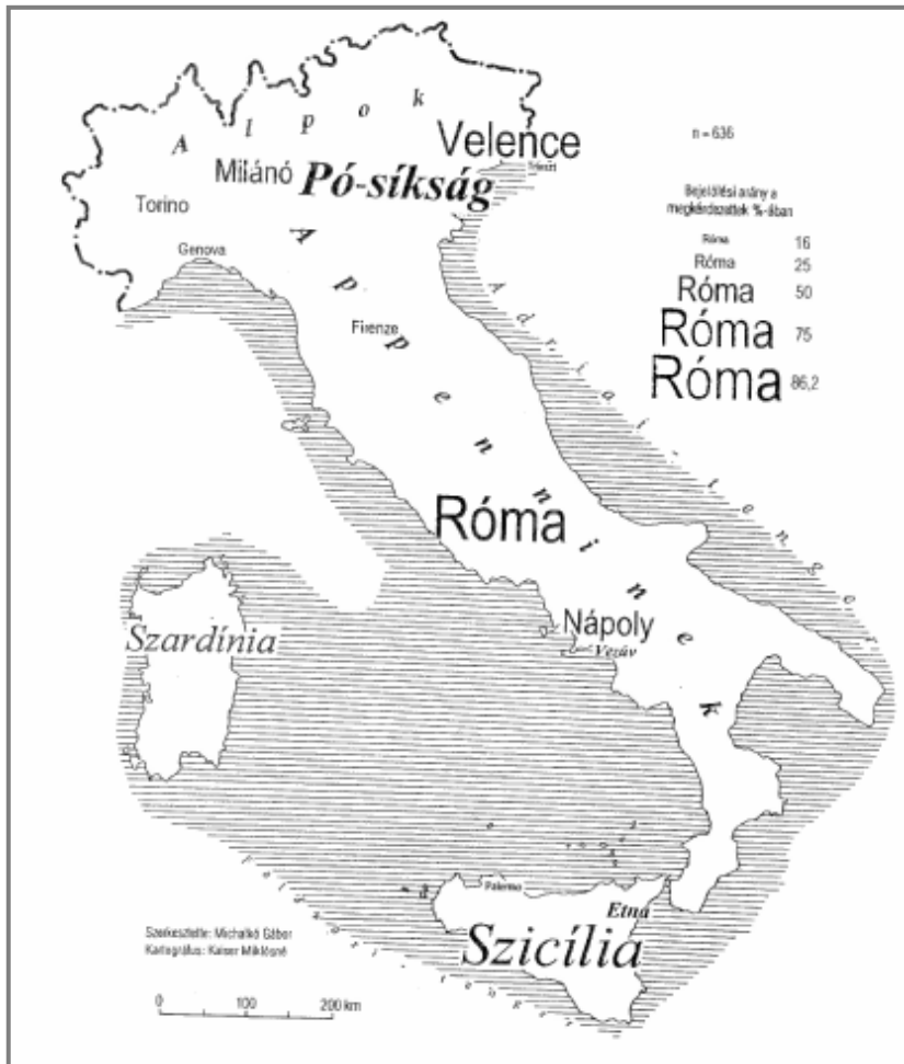
2. ábra: Olaszország legfontosabb térképi elemei a magyar középiskolások fejében

Adott országra irányult Michalkó Gábor mentális térképvizsgálata is. Kutatásában érettségi előtt álló fiatalokat kérdezett meg a bennük élő Olaszország képpel kapcsolatban. A válaszadóknak egy Olaszország kontúrtérképen kellett a lehető legtöbb földrajzi nevet bejelölniük.