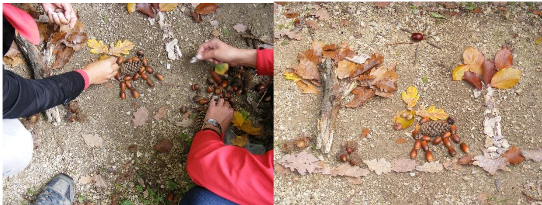
2. kép: Erdőkép a természet kincseiből

Az erdőpedagógia módszereinek színes tárháza, a természetismereti, erdőpedagógiai játékok segítségével a résztvevők az erdő növény-, és állatvilágával, az erdei ökoszisztémákkal, az erdő funkcióival, az erdőgazdálkodás alapjait sajátíthatják el. A feladatok, a játékok, az élmények és tapasztalatok, a résztvevők megfelelő ismereteit, módszertani ötlettárát gyarapítják (2. kép).