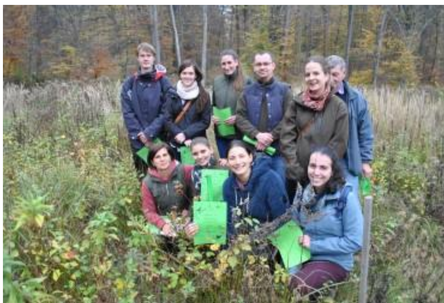
1. kép: Közös faültetés a Soproni Madarak és Fák Napja Emlékerdőben (2019)

A „Környezetünk az erdő” pedagógus továbbképzések szervezése mellett, a felmerülő igényekre reagálva az EVGI kidolgozta, az unikális Erdőpedagógiai szakvezető, Erdőpedagógiai szakmérnök szakirányú továbbképzését. Az oktatás ez esetben is a két kar oktatóinak közreműködésével zajlik. A szakirányú továbbképzés a pedagógusok és az erdőmérnökök körében egyaránt népszerű. A közös, három szemeszteres erdőpedagógiai továbbképzés az elméleti, gyakorlati módszertani, ismeretek mellett erdőtudatosságot, attitűdöt formál (1. kép). A továbbképzés a pedagógusok és erdészek közötti személyes és szakmai kapcsolatokat, a környezeti nevelésben az együttműködés igényét is erősíti.