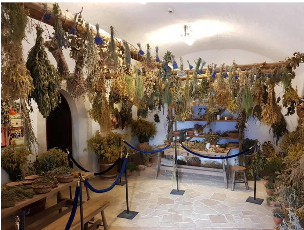
1. kép: Diósgyőri vár gyógynövényterme