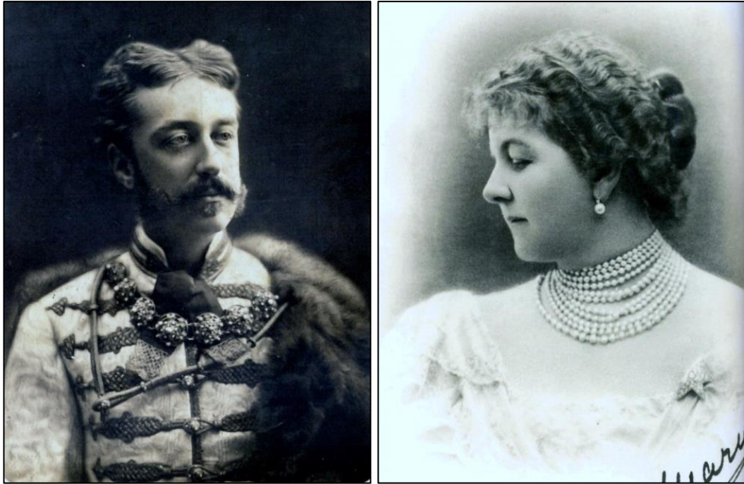
1. ábra: Gróf FESTETICS TASZILÓ és felesége Lady MARY-VICTORIA DOUGLAS-HAMILTON Figure 1. Count TASZILÓ FESTETICS and his wife Lady MARY-VICTORIA DOUGLAS-HAMILTON