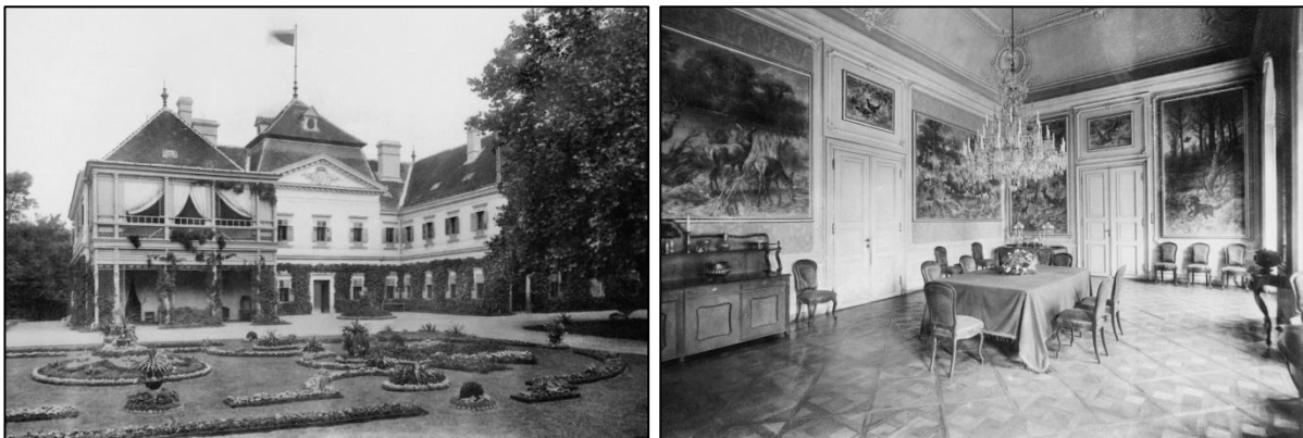
3. ábra: FESTETICS TASZILÓ gróf berzencei vadászkastélya (bal), ebédlő vadász faliképekkel a berzencei vadászkastélyban (jobb) (Fotók: KLÖSZ GYÖRGY, 1896.)

A FESTETICS-birtok területe 1885-ben 131 436 hold (53 190 ha) volt. Ebből legnagyobb kiterjedésű terület az erdő volt, összesen 53 000 hold (21 448 ha). Ennek a jelentős része Keszthelyen és Csurgón feküdt. A 29 780 hold (12 051 ha) szántó \frac{1}{4} -e Csurgón, \frac{1}{4} -e Taranyban volt megtalálható. A keszthelyi uradalom szántóterülete nagyságrendileg a harmadik volt a birtokon. A legelőterületek – 14 000 hold (5 665 ha) – leginkább (70%) Balatonszentgyörgyön és Keszthelyen voltak. Nádas művelési ág ugyancsak a Balaton melletti birtokokon volt. A szőlőterületek – 80 hold (32 ha) – zömében Keszthely környékén voltak fellelhetők (2. ábra).