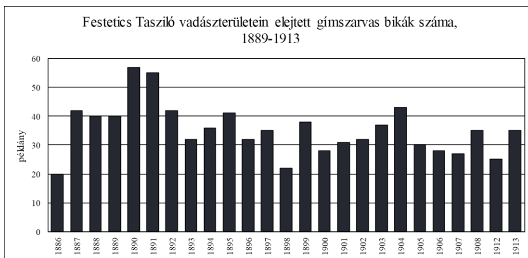
5. ábra: FESTETICS TASZILÓ vadászterületein elejtett gímszarvas bikák száma 1889–1913

Figure 5. The number of red deer stags killed in the hunting grounds of Prince TASZILÓ FESTETICS