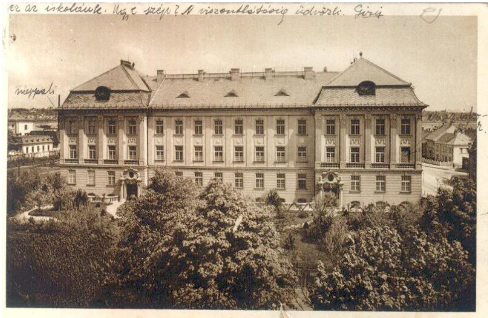
A Szent József Intézet (a kert felől)

A Házszenelésre 1928. március 4-én került sor. Az ünnepségen gróf Klebelsberg Kunó is jelen volt, akit a kápolnaszentelési szentmise után a város díszpolgárává avattak. Az iskola ügyét lelkesen támogató miniszter tiszteletére később Sopron – a nővérek kezdeményezésére – az iskola utcanevét Fürdőház utca helyett gróf Klebelsberg Kunó utcára változtatta.