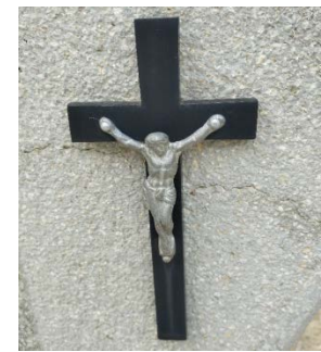
1. ábra. Szokványos templomképek és temetői keresztek (Kecskemét).

Szokványos templomképek és temetői keresztek (Kecskemét). Az ilyen és hasonló alkotások bemutatását vég nélkül folytathatnánk. Michelangelo Crucifix , ( Santa Maria del Santo Spirito, Firenze ) alkotásán a megadás, a belenyugvás érzete látható, legalábbis ezt sugallja a kép. Matthias Grünewald A keresztfeszítés című vázlatán a mérhetetlen fájdalom és szenvedés látszik. Dali Keresztes Szent János Krisztusa című festményén elsötétült a világ, Jézus merész testtartásán az fejeződik ki, hogy abban a pillanatban elhagyta a földi életet. Botero Krisztus című alkotásán tudatosan elkövéríti, lényegében eltorzítja Jézus testét. Mint minden festményén és szoboralkotásán az a koncepció olvasható ki, hogy a fogyasztói társadalom embere a túlzásba vitt fogyasztása révén kivetkőzik normális embermivoltából: a művész próbálja rádöbbeneni az emberiséget az ilyen típusú veszélyhelyzetre. Fadrusz János Krisztus a keresztfán , ( Szeged, Dóm ) című alkotásán, Jézus arcán megjelenik a szelídség: így is lehet kifejezni az önfeláldozást. A Szent Erzsébet templom (Szeged, Újszeged) feszülete különös történetet rejt: