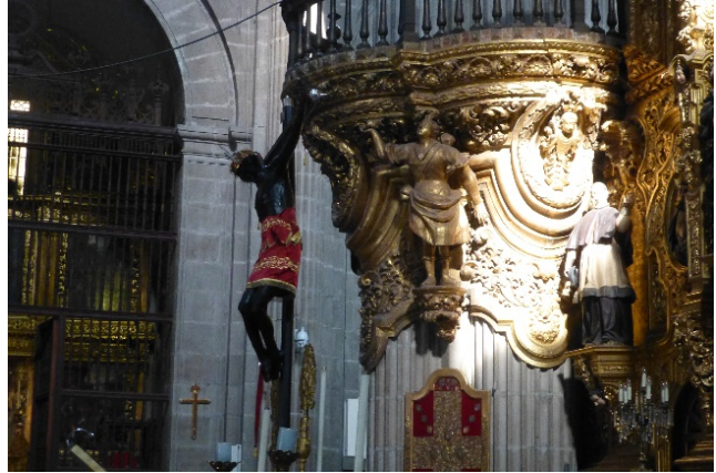
3. ábra: Fekete Jézus, Mexikóváros.

Összességében megállapítom, hogy valamennyi, itt bemutatott autonóm műalkotásban ott rejlik valamilyen eredeti, csak a szerző által felfedezett új és mély gondolat, merész megközelítés. Az ábrázolás nem hétköznapi, nem szokványos, amely így arra készíti a szemlélőt, hogy megálljon egy pillanatra, időzzék el egy keveset az alkotás előtt, és mozgósítsa szellemi-lelki energiáit.