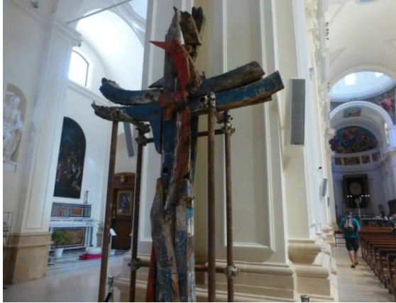
2. ábra: Noto (Szicília), Szent Miklós székesegyház különös fakeresztje.