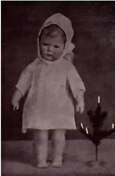
BÁBU. Tervezte Kruse Käthe asszony. Készült saját műhelyében Bad Kösen-ben. (Eredeti képaláírás az Élet című folyóiratból)