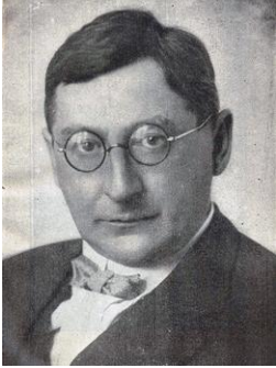
Gróf Klebelsberg Kuno