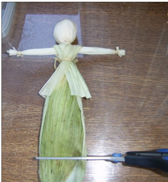
1. kép: Csuhebaba