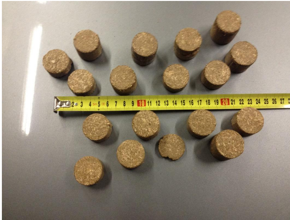
1. ábra: Késztermék szarvasmarhatrágya briklett