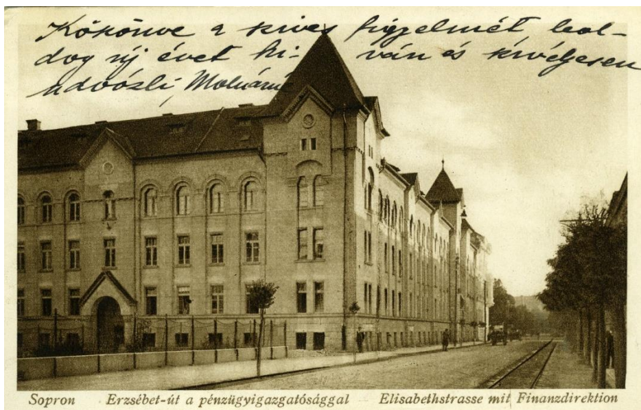
Figure 1: The completed financial palace