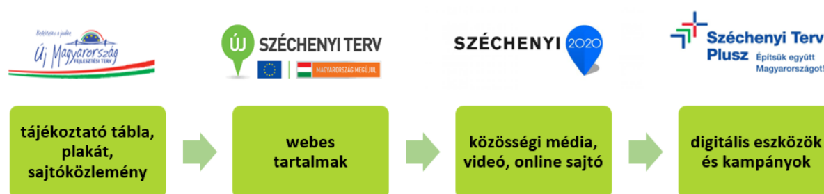
2. ábra: Kötelező és alkalmazható marketingeszközök

A jelenlegi elvárások alapján a hangsúly a digitális eszközök és kampányok integrált alkalmazására helyeződik. A kommunikáció ebben a megközelítésben már nem elszigetelt eszközök halmaza, hanem tudatosan tervezett kampánylogika mentén szerveződik. A digitális platformok, célzott online kampányok és adatvezérelt megoldások a stratégiai kommunikáció irányába mutatnak, ahol a cél nem csupán az információátadás, hanem a bevonás, a kapcsolatépítés és a fejlesztések hozzáadott értékének bemutatása.