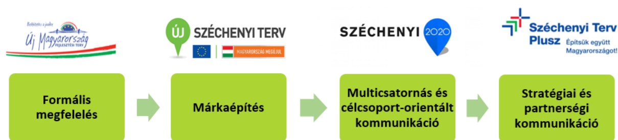
1. ábra: Kommunikációs szemlélet változása

A fejlődési ív jelenlegi végpontját a Széchenyi Terv Plusz által megtestesített stratégiai és partnerségi kommunikáció jelenti. Ebben a megközelítésben a kommunikáció már a fejlesztéspolitika stratégiai eszközeként értelmezhető. A kommunikáció középpontjában a hosszú távú kapcsolatok kialakítása, a partnerségi együttműködések erősítése, a társadalmi párbeszéd elősegítése, valamint a fejlesztések által létrehozott hozzáadott érték tudatos bemutatása áll. Ez összhangban van a szakirodalom megállapításaival, amelyek szerint a projektek kommunikációja akkor tekinthető hatékonnak, ha képes a fejlesztések eredményeit és értékteremtő hatását világosan közvetíteni, és azokat az érintettek számára releváns, értelmezhető módon bemutatni (Kotler & Keller, 2016).