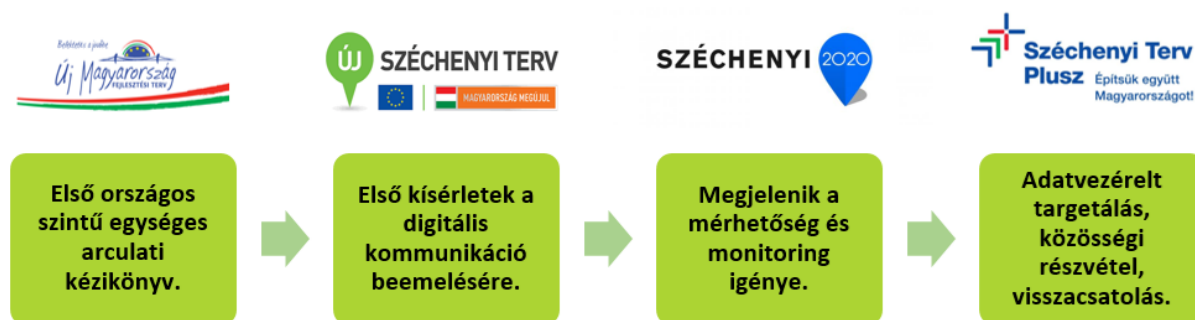
3. ábra: Tapasztalható innováció

2021 óta az innováció az adatvezérelt targetálás, a közösségi részvétel és a visszacsatolás hangsúlyos megjelenésében érhető tetten. Elméleti szinten a kommunikáció ebben a megközelítésben már képes alkalmazkodni a különböző célcsoportok eltérő igényeihez, és lehetőséget teremt a kétirányú kommunikációra, valamint az állampolgári és kedvezményezett visszajelzések beépítésére.