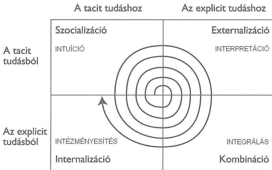
1. ábra: A tudáskonverzió modellje